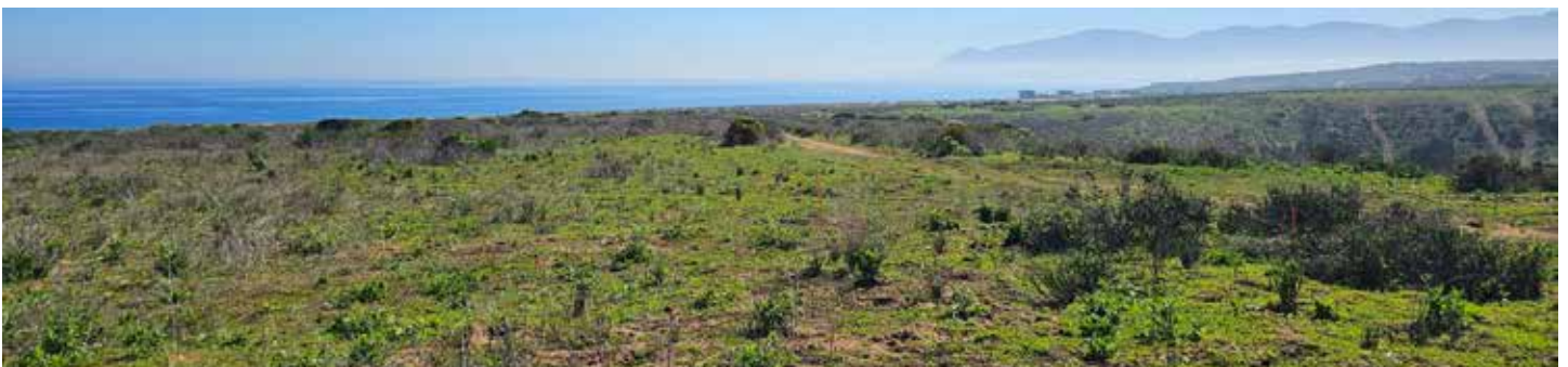
7ª LÍNEA NORTE