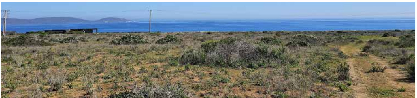
8ª LÍNEA SUR