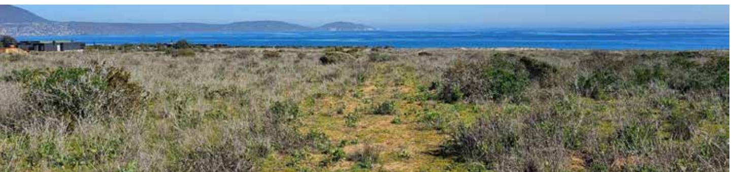
5ª LÍNEA SUR