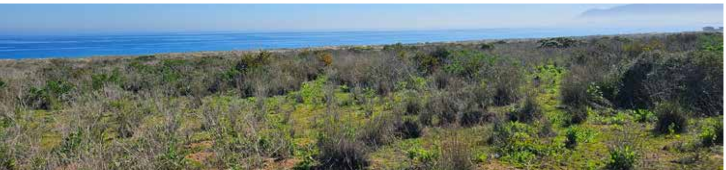
5ª LÍNEA NORTE