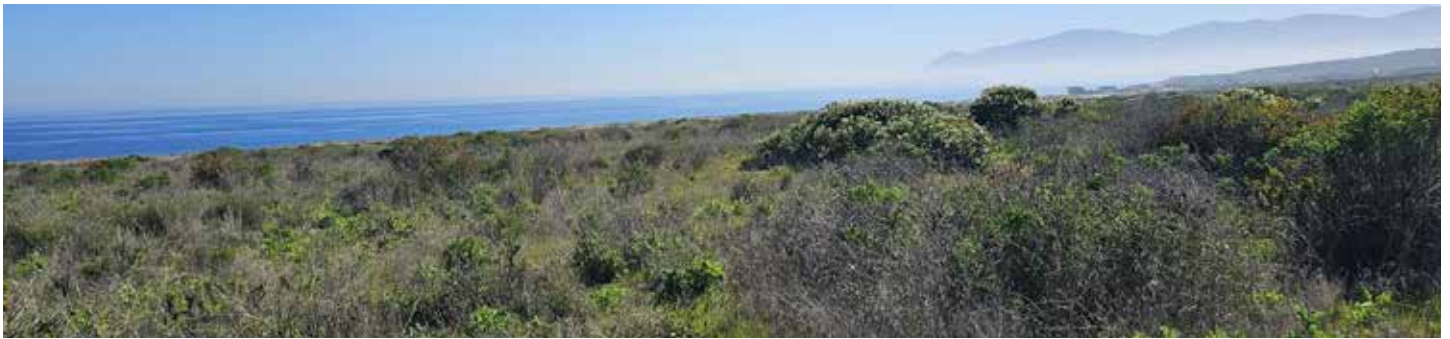
6ª LÍNEA NORTE