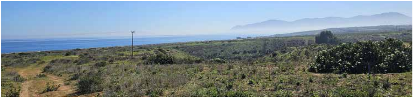
8ª LÍNEA NORTE