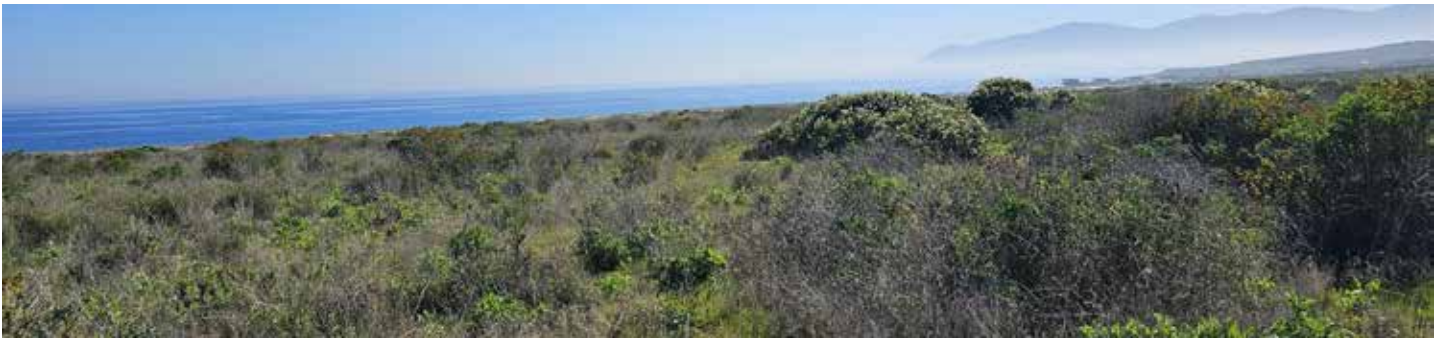
4ª LÍNEA NORTE