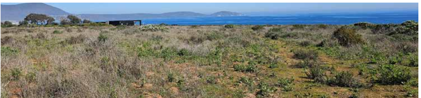
7ª LÍNEA SUE