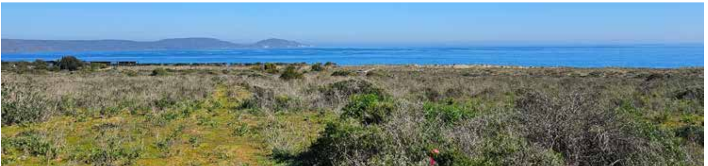
4ª LÍNEA SUR