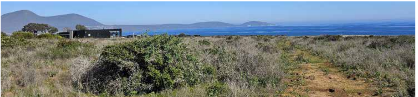
6ª LÍNEA SUR